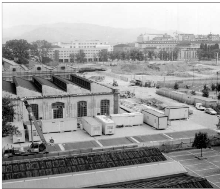
L'industria occidentale si sta specializzando nelle produzioni di elevata qualità

In effetti, confrontando le classifiche dei diversi paesi fatte utilizzando i valori a parità di potere d'acquisto (che la Banca Mondiale da qualche anno calcola), si ottengono valori e posizioni ben