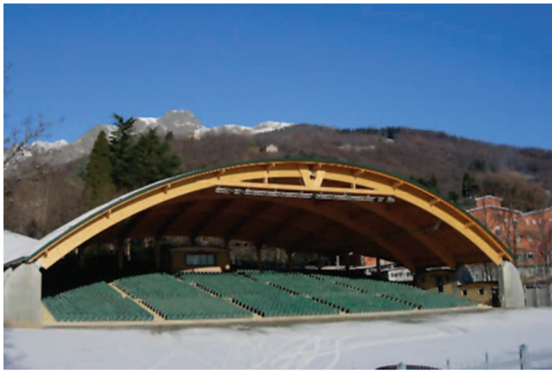
L'anfiteatro coperto e la planimetria della scena

Dal 1490 circa, l'azione scenica veniva realizzata il Venerdì